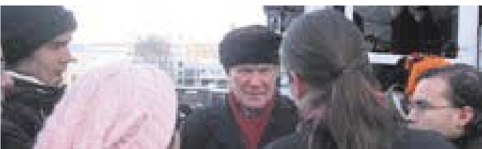
Keskusteluja Paavon kanssa.

Hän valitsee rohkean, luotettavan presidentin. Paavo Lipponen.