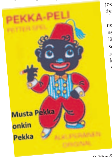
Kuka pelaa Naantalissa Mustaa Pekkaa?

Päätöksien aikaansaaminen edellyttää valtuuston kaltaisessa suuressa kollegiossa ryhmätoimintaa: samanmielisesti ajattelevat ovat järjestäytyneet puolueiksi ja puolueryhmiä, jotka keskuudessaan etsivät yhteistä linjaa. Sitä he tarjoavat muillekin ryhmille. Lopullinen päätös syntyy