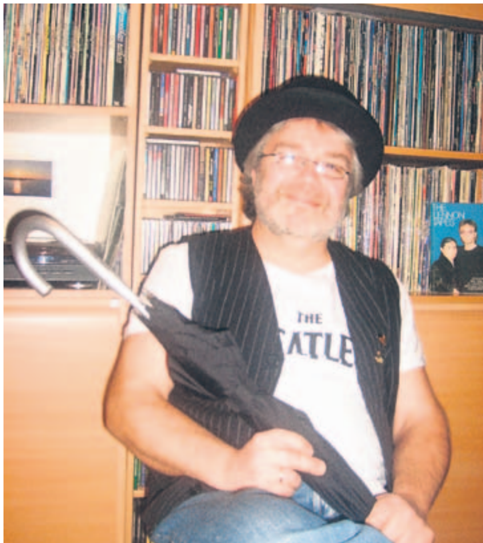
Knalli ja sateenvarjo -miehen hyllystä löytyy neljä tuhatta äänilevyä.