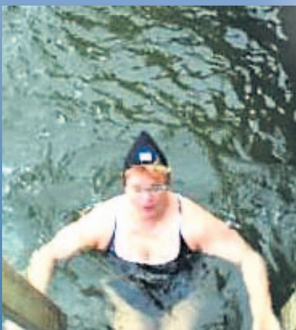
Hei, tulkaa UIMAAN!