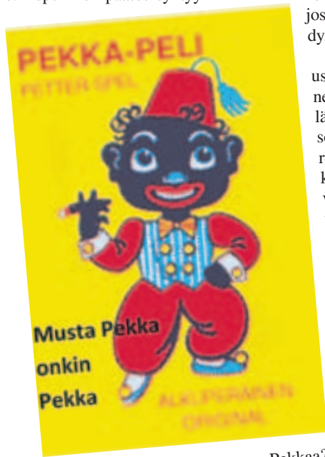
Kuka pelaa Naantalissa Mustaa Pekkaa?

Päätöksien aikaansaaminen edellyttää valtuuston kaltaisessa suuressa kollegiossa ryhmätoimintaa: samanmielisesti ajattelevat ovat järjestäytyneet puolueiksi ja puolueryhmiksi, jotka keskuudessaan etsivät yhteistä linjaa. Sitä he tarjoavat muillekin ryhmille. Lopullinen päätös syntyy