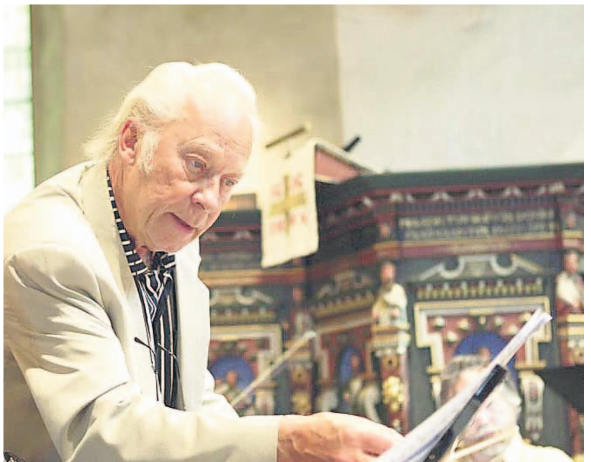
Aulis Sallinen on säveltänyt viimeiset kymmenen vuotta kamarimusiikkia. Työskentelyä innostavat myös nuoret muusi- kottajat, jotka toivovat teoksia uusille soittimille, kuten kitaralle ja harmonikalle.

kymmenisen vuotta kamarimusiikin parissa. Sen jälkeen kun 8. sinfonia valmistui 2001, hän ei ole säveltänyt