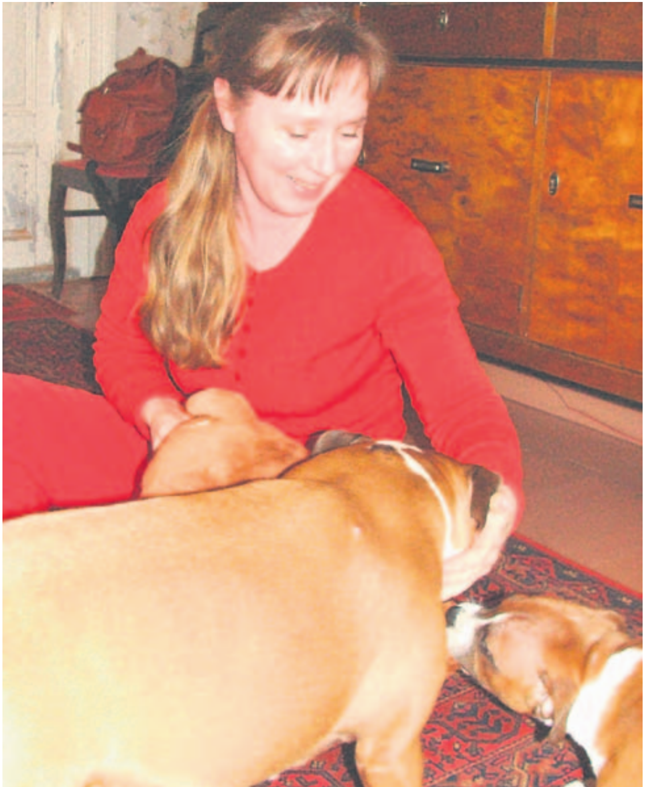
Tyttö ja Poppet leikkivät emäntänsä kanssa.

”Liikkuminen ja koko Röölan rannan elämä vaikeutuu entisestään, kun yhteysalusliikenne Röölastä on päätetty kesälläkin lakkauttaa.”